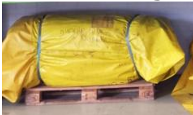
Figuur 1 Pakket